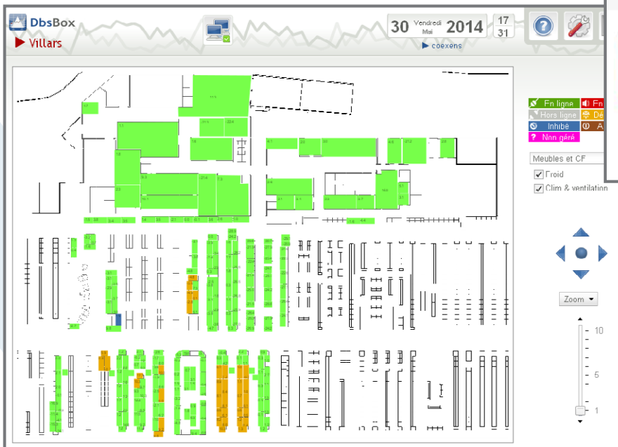
Synoptique dynamique avec zooms, raccourcis, variables principales et états par code couleur