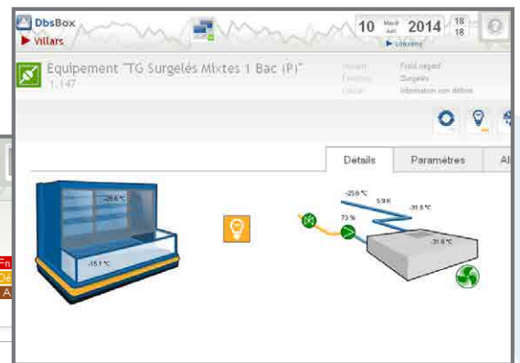
Interface universelle avec régulateur, équipement, schéma animé, commandes, onglets Paramètres et Alarmes