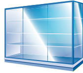
Meuble de vente sur centrale